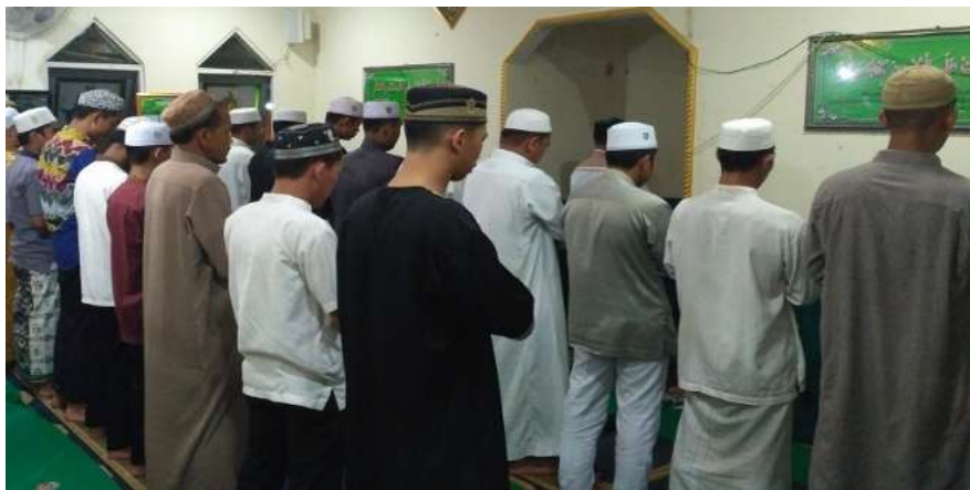
Gambar 2. Pelaksanaan Tarawih Bersama Imam yang Sudah Terjadwal

Refleksi dari hasil penelitian ini menunjukkan bahwa pendampingan dalam penyusunan jadwal imam tidak hanya meningkatkan efektivitas ibadah Tarawih, tetapi juga memberikan kesempatan bagi calon imam muda untuk berlatih kepemimpinan dalam ibadah berjamaah. Dengan keterlibatan aktif dari takmir mushalla dan calon imam, program ini berkontribusi pada penguatan kapasitas kepemimpinan keagamaan di tingkat komunitas. Hal ini sejalan dengan tujuan pengabdian untuk meningkatkan kesiapan imam serta memperkuat koordinasi antar pengurus mushalla agar ibadah Ramadhan berjalan lebih tertib dan efektif.