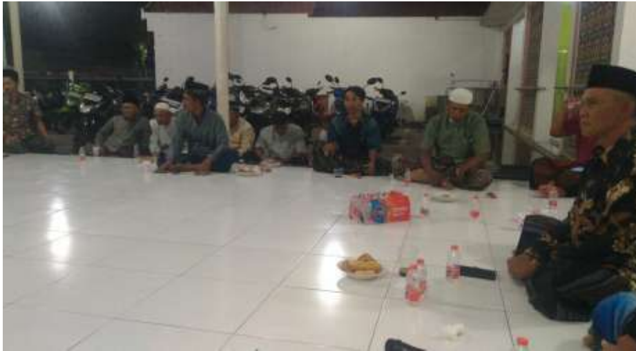
Gambar 1. Musyawarah Penyusunan Jadwal Imam Tarawih

Refleksi dari hasil penelitian ini menunjukkan bahwa pendampingan dalam penyusunan jadwal imam tidak hanya meningkatkan efektivitas ibadah Tarawih, tetapi juga memberikan kesempatan bagi calon imam muda untuk berlatih kepemimpinan dalam ibadah berjamaah. Dengan keterlibatan aktif dari takmir mushalla dan calon imam, program ini berkontribusi pada penguatan kapasitas kepemimpinan keagamaan di tingkat komunitas. Hal ini sejalan dengan tujuan pengabdian untuk meningkatkan kesiapan imam serta memperkuat koordinasi antar pengurus mushalla agar ibadah Ramadhan berjalan lebih tertib dan efektif.