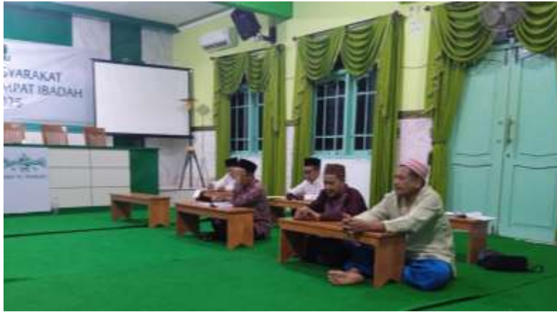
Gambar 3. Evaluasi Pelaksanaan Tarawih dan Imam Tarawih

jadwal imam di masjid atau mushalla lain yang menghadapi permasalahan serupa, sehingga memiliki kontribusi praktis dalam pengelolaan ibadah berjamaah di masyarakat Muslim.